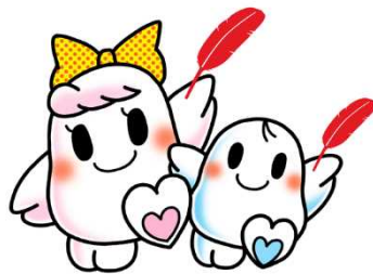
あいち 愛ちゃん と きぼう 希望くん