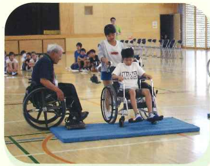
学校での福祉教育