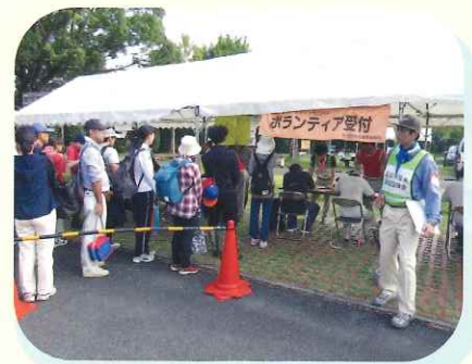
大規模災害時のボランティア活動支援