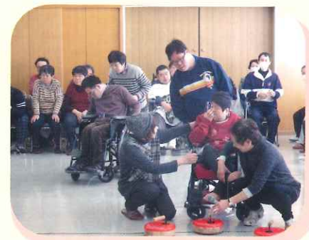
障がいのある方のために