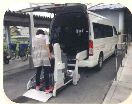
福祉施設の車両整備

赤い羽根共同募金は、高齢者、障がい者、子どもたちへの地域の福祉活動を支援する募金です。災害時には、被災地支援にも役立っています。