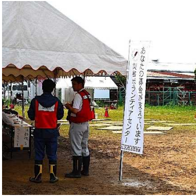
災害時のボランティア活動など被災地を支援するために