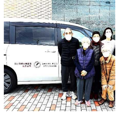
福祉施設の利用者などを送迎するために

お問い合わせ 社会福祉法人 愛知県共同募金会 〒461-0011 名古屋市東区白壁一丁目50番地（愛知県社会福祉会館内） TEL: 052-212-5528 FAX: 052-212-5529 e-mail: info@aichi-akaihane.or.jp http://www.aichi-akaihane.or.jp/