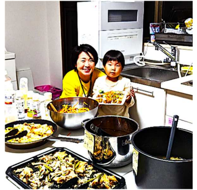
孤食防止・居場所づくりなどを行う子ども食堂支援のために