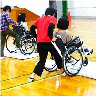
福祉への理解と関心を深めてもらうために（福祉実践教室）