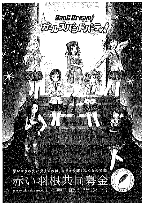
ポスター3 バンドリ!ガールズバンドパーティ! コラボレーション

©BanG Dream! Project ©Craft Egg Inc. ©bushiroad All Rights Reserved.