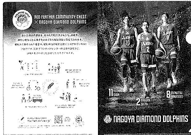
名古屋ダイヤモンドドルフィンズ コラボレーション クリアファイル