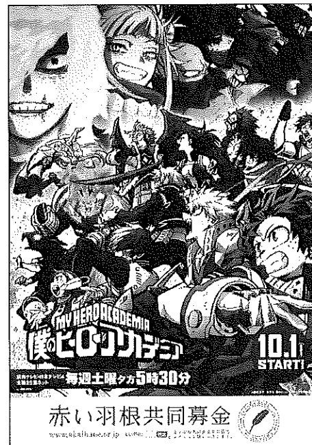
ポスター4 僕のヒーローアカデミア コラボレーション

©BanG Dream! Project ©Craft Egg Inc. ©bushiroad All Rights Reserved.