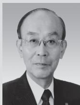
社会福祉法人 愛知県共同募金会 会長

令和6年能登半島地震では、被災地の災害ボランティアセンターやボランティア団体の活動支援等のため、災害等準備金積立金から1,920万円を拠出しました。