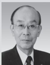
社会福祉法人 愛知県共同募金会 会長