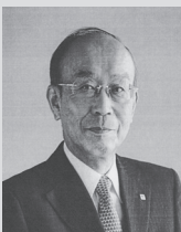
社会福祉法人 愛知県共同募金会 会長